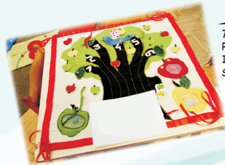
7. „ČAROBNO DRVO” - IGRAČKA/DID. SREDSTVO 5-7 GOD. PU „DEČIJA RADOST” IRIĞ Slavica Matešić, vaspitač