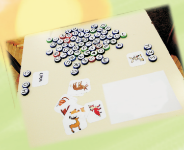
9. „SLOVO PO SLOVO ... REČ’ - DID. SREDSTVO 6-7 GOD. PU „NAŠA RADOST” SUBOTICA Nataša Sopka, vaspitač