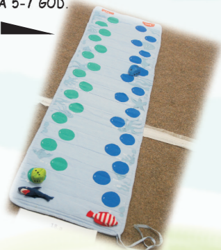
19. „JA VOLIM ŽIVOTINJE” - DID. SREDSTVO 4-5 GOD. PU „NAŠA RADOST” SUBOTICA Dragana Stantić, vaspitač