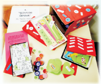
4. „SLOVA OD ČEPOVA” - DID. SREDSTVO 6-7 GOD. PU „NAŠA RADOST” SUBOTICA Snežana Jocić - vaspitač