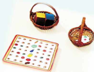
13. „ZDRAVA KORPA” - IGRAČKA 5-7 GOD. PU „NAŠA RADOST” SUBOTICA Nataša Vrapčević, vaspitač