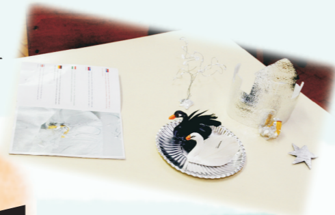
15. „SLIKOVNICA - BAJKA O LABUDU” - IGRAČKA/DID. SREDSTVO 3-7 GOD. PU „MLADOST” BAČKA PALANKA Sofija Radonić, vaspitač