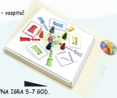
6. „RECIKLAŠKO” - DRUŠTVENO-EDUKATIVNA IGRA 5-7 GOD. PU „NAŠA RADOST” SUBOTICA Livia Tričko Stantić, vaspitač