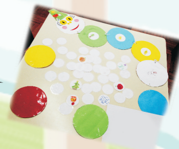
23a. „POGAĐALICA” - DID. SREDSTVO 4-6 GOD. PU „BOŠKO BUHA” VRBAS Vesna Vučetić, vaspitač