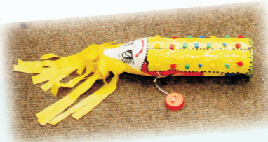
14. „LUTKICA STOPALICA” - IGRAČKA 3-7 GOD. PU „DRAGOLJUB UDICKI” KIKINDA Olivera Ivanović, vaspitač