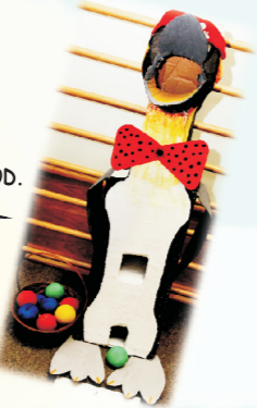
2. „NAHRANI PINGVINA PINGU PINGU” - IGRAČKA 4-7 GOD. PU „NAŠA RADOST” SUBOTICA Monika Laudis Nanaši - vaspitač