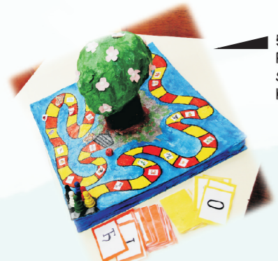
5. „EKO SLOVARICA” - DRUŠTVENA IGRA 5-7 GOD. PU „NAŠA RADOST” SUBOTICA Ksenija Štefković - vaspitač